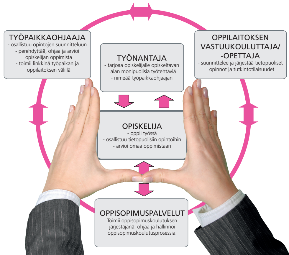
KUVA: Oppisopimusosapuolten roolit ja sitoutuminen

Oppisopimuskoulutus on opiskelijan, työnantajan, oppilaitoksen ja oppisopimuspalveluiden kanssa yhteistyönä järjestettävää koulutusta.