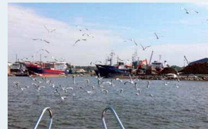
Kuģi Salacgrīvas ostā

Baltijas jūra ir viena no pasaulē visnoslogotākajām jūrām kuģu satiksmē. Pēdējo 10-20 gadu laikā būtiski palielinājies gan kuģu skaits, gan to lielums. Īpaši tas attiecas uz naftas tankkuģiem, un ir paredzams, ka nākotnē šī tendence pieaugs vēl vairāk.