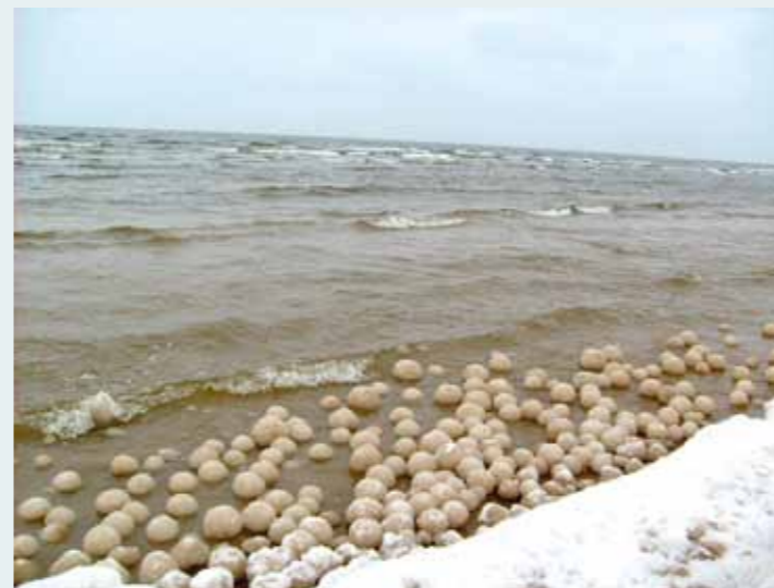
Sniega bumbas Majoru pludmalē 31.12.2009

Nosaukums „Baltijas jūra” („Mare Balticum”) pirmo reizi lietots 11. gadsimtā, par autoru tiek uzskatīts hronists Ādams no Brēmenes, atsaucoties uz mītisko Baltijas salas nosaukumu. Pastāv arī iespēja, ka nosaukums veidots no ģermāņu vārda belt, ar kuru tiek apzīmēti vairāki Dānijas šaurumi. Cits skaidrojums - vārds cēlies no senās indoeiropiešu valodas vārda saknes *bhel, kas nozīmē - balts, mirdzošs. Šī vārda sakne saglabājusies arī vairākās mūsdienu indoeiropiešu valodās, tai skaitā latviešu valodā. Baltijas jūras nosaukums ir devis nosaukumu Baltijas valstīm.